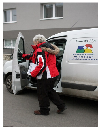
doprava ke klientům

Terénní pečovatelská služba byla poskytována pracovníky v sociálních službách v přepočtu na úvazky 8,91. Celkový počet zaměstnanců na středisku pečovatelské služby byl v přepočtu na úvazky 10,31. V roce 2013 se navýšila délka doby poskytované péče u klientů v jejich domácím prostředí.