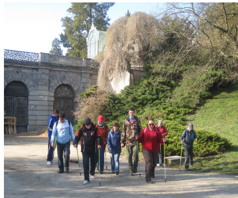
chůze s holemi v lednickém parku

Ve středisku v roce 2013 pracovalo přepočteno na úvazky v přímé péči 5,27 zaměstnanců, celkem přepočtený stav zaměstnanců ve středisku činí 6,10 úvazku.