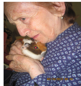
morče je oblíbeným společníkem

Klientům v zařízení bylo poskytnuto ubytování, strava 5x denně, diabetici 6x denně. Dále péče, kterou jim poskytovali pracovníci v sociálních službách v přepočtených úvazcích 11,48. Všech pracovníků na středisku bylo 14,28.