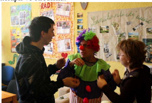
Příprava na karneval