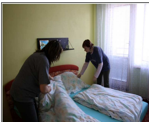
Pomoc osobního asistenta

Péče je založena na individuálním přístupu, je zde uplatňována spolupráce s uživatelem služby, individuální přístup k uživateli služby, podílet se na výběru osobního asistenta spolu s poskytující organizací při samotných výběrech osobního asistenta.